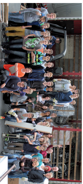
☐ Schülerinnen und Schüler der Karl-Rehbein-Schule helfen beim Beladen (2014)

Wir sind ein fünfköpfiges Leitungsteam mit bis zu 50 projektbezogenen Helfern. Alle arbeiten ehrenamtlich und unentgeltlich. Träger ist die Evangelische Stadtkirchengemeinde Hanau. Unsere Arbeit umfasst: • Aufbau und Unterstützung des Christian Medical Center durch Spenden und Arbeit vor Ort • Weiterbildung von Ärztinnen und Ärzten sowie medizinischem Fachpersonal in Mukachevo und auch in Deutschland durch Hospitationen • Sammlung von medizinischem Material und Gerät in Deutschland. • Vorbereitung und Durchführung von Hilfsgütertransporten • Akquisition von Geldspenden