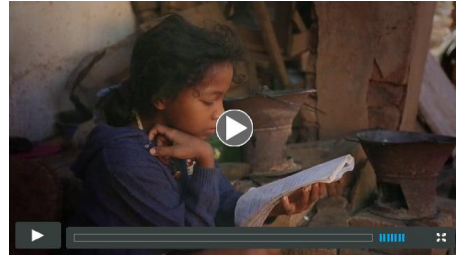
Let Us Learn: Supporting girls' education in Madagascar

Für ein weiteres Video von UNICEF mit mehr Informationen zu unserem Madagaskar Programm, click here . (Link kann nur im englischen Original geöffnet werden)