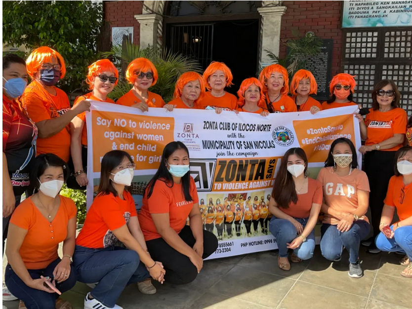
Zonta oranges the World, auch in San Nicolas, Philippinen.

Aktueller Bericht von UN Women zeigt enormes Ausmaß