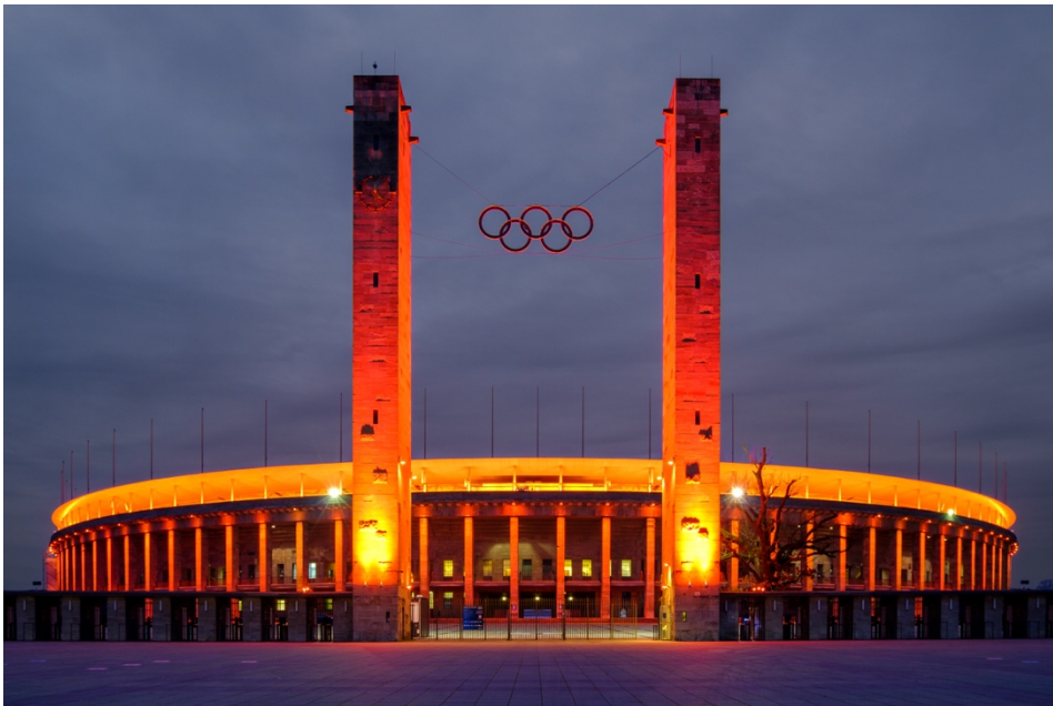
Orange Leuchtzeichen gegen einen verstörenden Rekord der Gewalt gegen Frauen.

Berlin, 07. Dezember 2021 – Es passiert jeden Tag in Deutschland. Den Zahlen der aktuellen Statistik des Bundeskriminalamtes zufolge üben pro Stunde mehr als 13 Männer Gewalt gegen ihre Ehe- oder Lebenspartnerin aus. Und das sind „nur“ die zur Strafanzeige gebrachten Körperverletzungen, Tötungsversuche und Tötungen. Anlässlich des Internationalen Tages der Menschenrechte fordert die Union deutscher Zonta Clubs zum Ende der diesjährigen Zonta Says NO-Aktionen im Rahmen der UN-Kampagne „Orange the World“ ein Umdenken in der Gesellschaft.